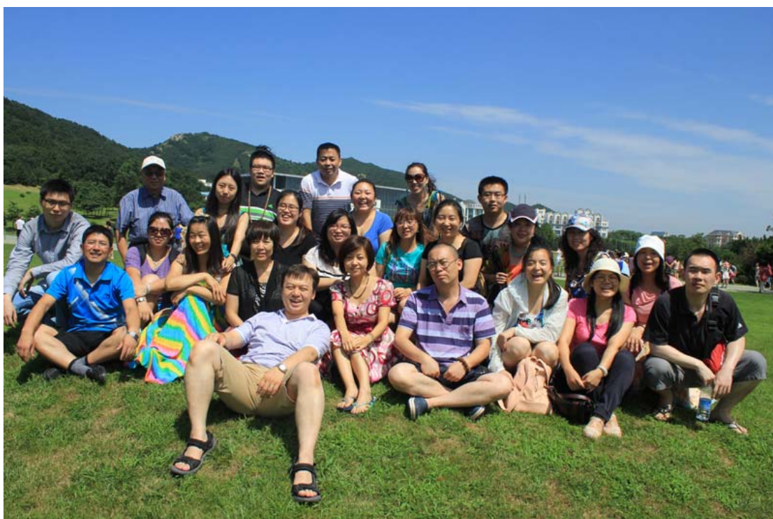
蓝天白云 绿草秋风