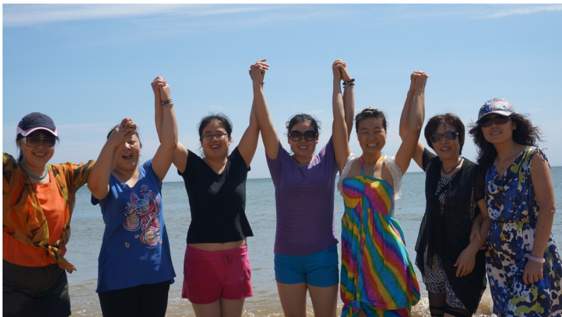
携手同心 再接再厉