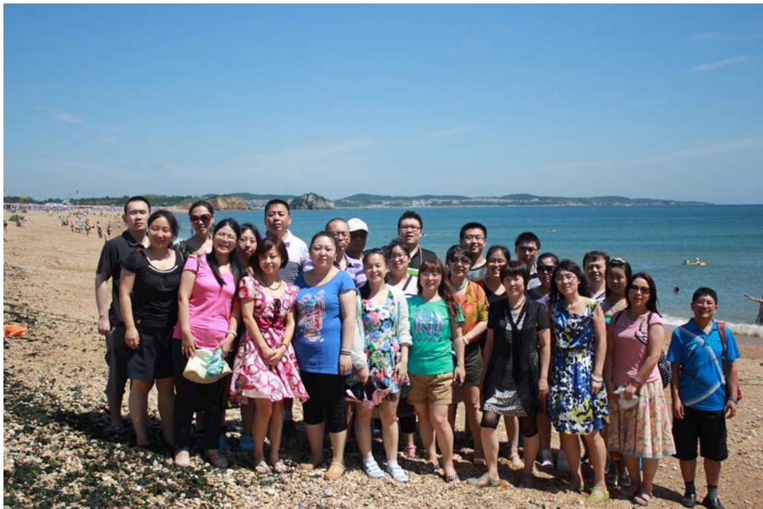
遨游碧海 金石沙滩

组织旅游活动，放松心情： 为使员工的精神能在紧张的工作中得到调节，我公司每年组织郊游活动，在蓝天白云之下无限接近大自然，放松心情，劳逸结合，充分体现了公司的以人为本的理念。通过这些活动，员工之间增进了了解，强化了友谊，凝聚了团队精神。